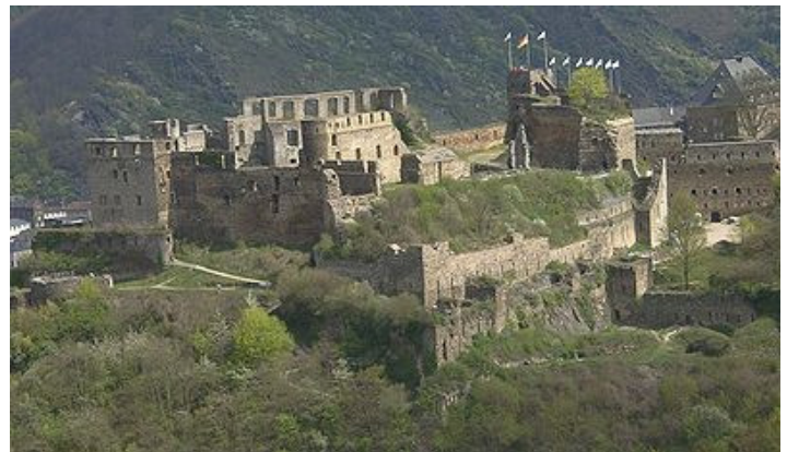
Burcht Rheinfels bij Sankt Goar

De Loreley wordt jaarlijks door vele toeristen beklommen. Op de rots ligt een uitkijkpunt, vanwaar men kan genieten van een door velen als schitterend ervaren panorama. Volgens een volksverhaal zou boven op de Loreley een zingende nimf met gouden haren hebben gezeten die met haar gezang de schippers afleidde, waardoor ze tegen deze rots voeren. Dat is hetzelfde thema dat ook bekend is van de Sirenen uit de Odyssee. Onderaan de Loreley staat een standbeeld van de nimf. De dichter Heinrich Heine heeft aan de hand van dit verhaal het gedicht die Loreley geschreven, waarbij ook een melodie werd gemaakt: Ich weiß nicht was soll es bedeuten, daß ich so traurig bin. Dit lied behoort nog steeds tot de populairste van alle Duitse liederen.