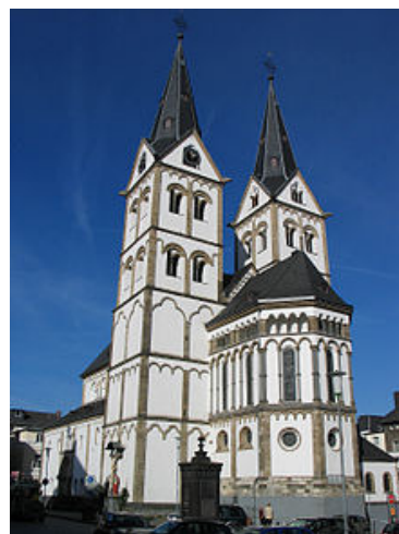
De Sankt Severus in Boppard.