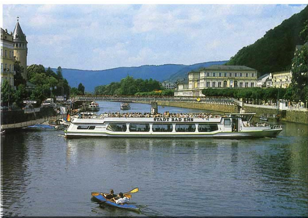
Een tochtje op de Lahn

De naam van ons koninklijke huis is verbonden met deze stad. Een bezoek aan de burcht Nassau welke in 1120 door de graven van Laurenburg is gebouwd en in 1255 na de Nassausche landverdeling in onverdeeld eigendom kwam van de afstammelingen van beide graven dynastieën. Bezienswaardig is de stamboom van het geslacht Nassau. Ook de moeite waard is de oude binnenstad met de oude Evangelische kerk, het raadhuis, veel kunstwerken in brons, die geschonken waren door de heer Leifheit toenmalig directeur van de gelijknamige firma. Verder een fraai kunst/speelwerk met de grote letters "N A S S A U" die kunnen ronddraaien en waarop alle contingenten staan waar de Nassau's zich bevonden. Hierbij is ook speciaal aan de kinderen gedacht. En niet te vergeten de lugubere heksentoren waar gewogen en gemarteld werd en vonnissen werden voltrokken. En in het restaurant Am alten Rathaus kun je heerlijk eten bij mooi weer wordt er buiten gegrild. De Lahn fietsroute richting Koblenz is voor een ieder te fietsen. Maar in de daluren mag de fiets gratis mee in de trein als je te moe bent om terug te fietsen.