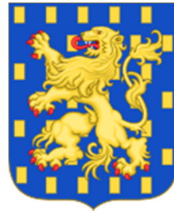
wapen van Nassau.