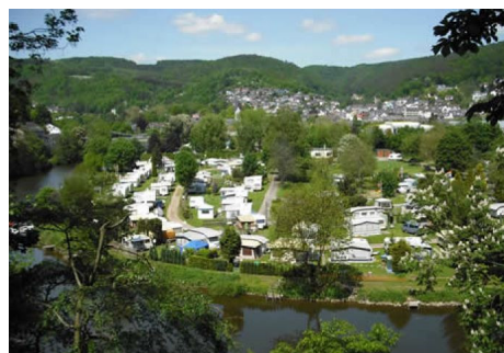
De camping in Nassau