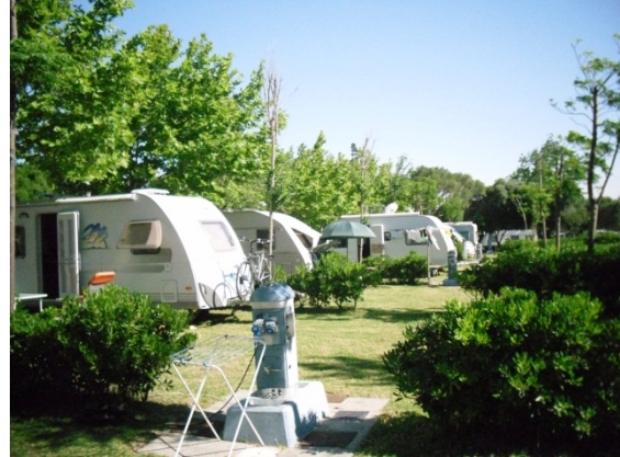
Camping Le Torre le Peña 2

Als we net na 13.00 uur op de camping aankomen ben ik er erg blij mee dat ik deze fantastische camping heb gekozen. De andere campings nabij Tarifa hebben kleine plaatsen en liggen volledig onder het blad.