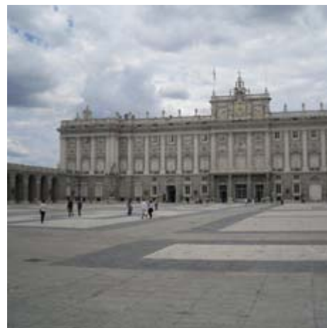
Koninklijk paleis in Madrid.

Na een uurtje Aranjuez gaan we door naar Toledo en zetten de auto's in de parkeergarage, van hier uit gaan we met de roltrappen naar de top van Toledo waar de informatie direct ligt. Zij geven ons een plattegrond en leggen uit hoe de route te lopen. Ongelooflijk al die mooie poorten en bouwwerken, het bezoek aan de kathedraal was weer een hoogtepunt in ieder geval Toledo mag je niet missen als je Spanje bezoekt. De vrijdag gebruiken we om weer boodschappen te doen, zelf te koken en een beetje bijkomen in de Spaanse zon bij temperaturen van maar 23oC.