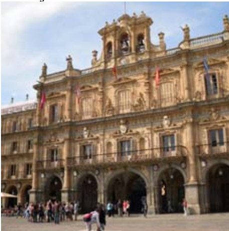
Plaza Major in Salamanca.