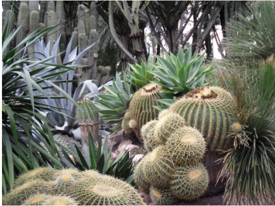
De cactustuin Huerto del Cura