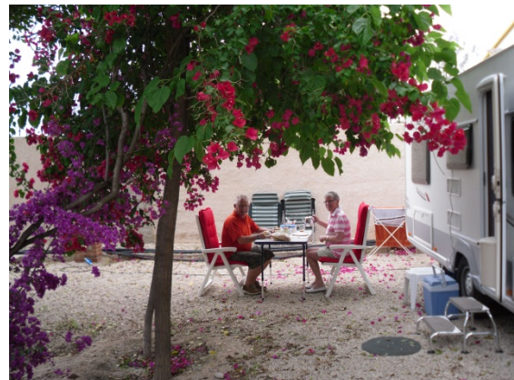
Mooi tussen de Bougainvillea's