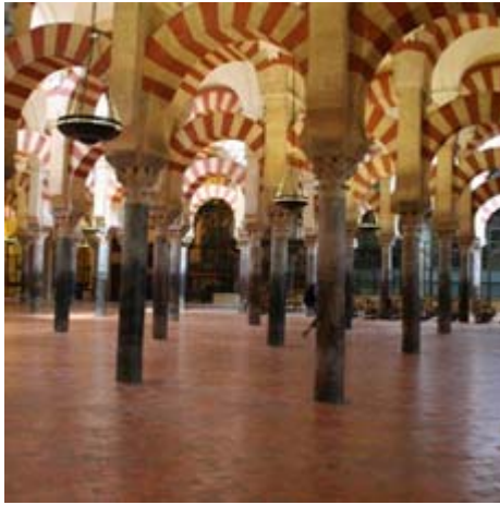
La Mesquita in Cordoba.

ieder om 16.00 uur is uitgekeken rijden we weer met de bus terug naar de camping.