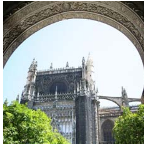
De kathedraal van Sevilla

We reddten het precies en zijn exact om 17.00 uur weer bij de bus die ons weer naar de camping brengt. Het is vandaag dik boven de 30°C geworden en op de terugweg valt bijna iedereen in slaap zo inspannend was deze mooie dag. Op de camping gaan de meesten even zwemmen in het heerlijke zwembad. Morgen weer voor ons klaar als eerste gaan we een prachtig kasteel in Almodovar del Rio een