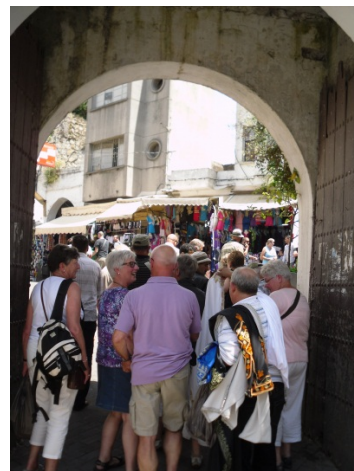
De Kasbah in Tanger .