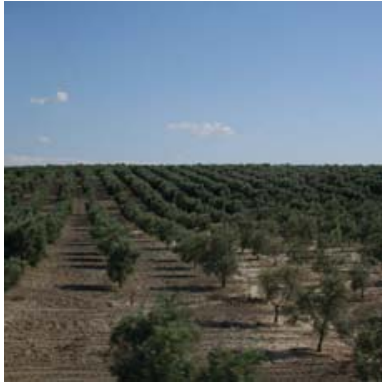
Olijf boomgaarden in Andlusië