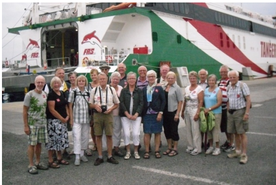
De groep op weg naar Marokko

later weten dat ze goed zijn aangekomen en volgende week woensdag weer terugvliegen, dan kunnen zij in Madrid weer aansluiten.