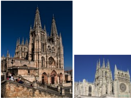
Kathedraal van Burgos

dames de kans om te winkelen. Van Madrid raak je niet zo onder de indruk qua bouwwerken maar met zijn autowegen, busstations, en metro is het wel een wereldstad. We raken ( met ons allen) ook een beetje vermoeid om steeds maar weer steden te bekijken. Maar Spanje zit er bijna op. Zondagmorgen vertrekken wij naar Burgos onze laatste stad in Spanje. Als we bij de camping aankomen is de receptie van de Municipal camping zeer onvriendelijk van de reservering klopt niets en de mevrouw die ons bevestigd heeft werkt er niet meer. Na overleg met Alex en de groep besluiten we om hier maar 1 nacht te blijven . Diegene die nog belangstelling heeft gaat Burgos met de fiets of de auto verkennen.