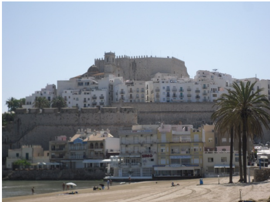
Peñíscola aan de Costa Azahar.

Natur Resort in Peñíscola . We hebben het midden terrein, welk is aangelegd met kunstgras, voor onze groep. Het is een mooie zeer goed onderhouden camping en heeft een mooi zwembad en een zeer grote sport en massage salon. We zitten dicht bij de kust en bijna iedereen gaat met de fiets naar het stadje waar je de 7 km lange boulevard af kunt fietsen. Het stadje Peñíscola is een mooie vestigingsstad met binnen de stadsmuren ontelbaar veel restaurantjes .