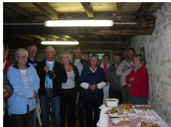
Gezellige Tapas avond

De hele nacht blijft het regenen tot 12.30 uur in de ochtend dan klaart het op en een ieder gaat er nog even op uit. De meesten willen de kust van Atlantische oceaan bezoeken want we zitten maar op 3 km van het strand. Gelukkig blijft het de hele middag droog en genieten we volop van dit mooie stukje Frankrijk.