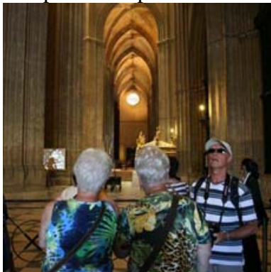
Je kijkt je ogen uit !

Zaterdagochtend in een lange rij staan we om 7.30 uur bij de receptie om ons broodje te halen niemand heeft in de gaten gehad dat we dit keer maar een broodje van 125 gram hebben besteld. Dus dat wordt in Sevilla koffie met gebak. De bus komt exact op tijd en we vertrekken prompt om 8.15 uur en zijn om 9.30 uur in Sevilla de chauffeur brengt ons in het hart van de stad en we gaan met 16 man op stap. Eerst kopen we kaartjes voor de hop on/off bus en het lukt mij om de kaartjes te kopen voor 10 € i.p.v. 16 € dus dat scheelt geweldig. Tegen 12.00 uur beginnen we aan de rondwandeling en we genieten volop van alle pracht die Sevilla ons biedt.