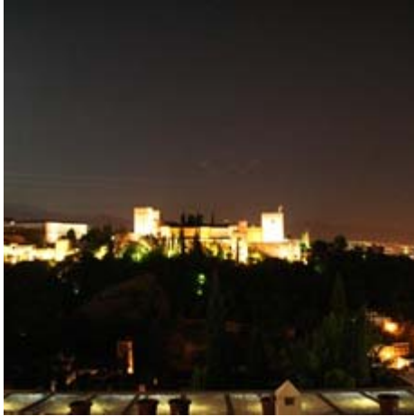
La Alhambra 's avonds