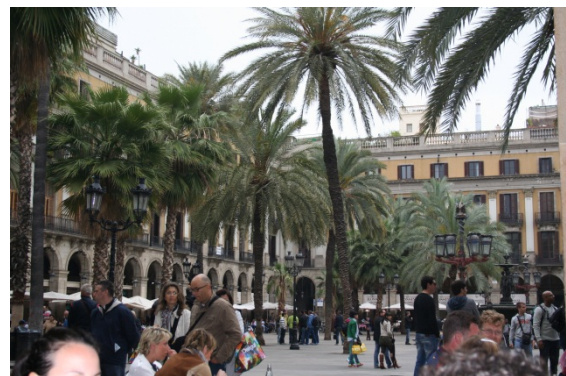
Placa Reial met veel terrassen.

De maandag wordt een luie dag we bereiden ons weer voor, voor de volgende etappe en gaan inkopen doen en de auto aftanken.