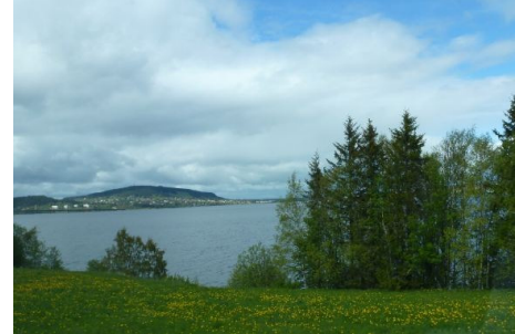
Na 4 dagen weer even zon.