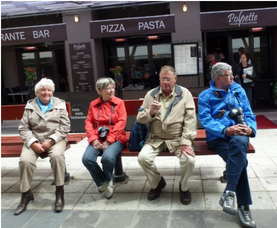
Even uitblazen in Stockholm

gezellig uurtje en we lachen er wat af. De gehele nacht blijft het regenen en we blijven dus maar bij de caravan, zo imposant is Stockholm ook niet, maar wij hadden nog graag de boottoer door de havens willen maken.