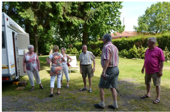
De eersten melden zich.

Zondag 27 mei vertrekken wij met 3 eenheden als eerste om 9.00 uur, het is een stralende dag en de reis naar het Noorden verloopt zonder problemen, we nemen van af Haderslev zelfs de oude weg om zo nog meer te kunnen genieten van de mooie Deense natuur. Om 14.00 uur worden we zeer vriendelijk ontvangen en we krijgen mooie plaatsen toegedeeld, het uitzicht over de grote Belt is prachtig met de nieuwe brug op de achtergrond. Om 19.00 uur gaan we aan tafel om te genieten van een typische Deense maaltijd, gehakte biefstuk in bruine uiensaus daarbij heerlijk gekookte aardappels, gemarineerde komkommer en rode bieten. De biefstuk ging er goed in en menigeen kon nog een zakje aardappels meenemen om deze de andere dag op te bakken. Na het diner heeft de reisleiding voor een ieder cadeautjes, voor de dames een elektrische muggenvanger en voor de heren een oranje pet met lampjes zodat ook in het hoge Noorden onze voetballers gesteund kunnen worden. Ook krijgt elke equipe een pak pannenkoekmeel om goed te bewaren, niemand vraagt zich af waarom? Er wordt nog gezellig na geklets maar als het begint af te koelen gaat een ieder weer terug naar zijn caravan.