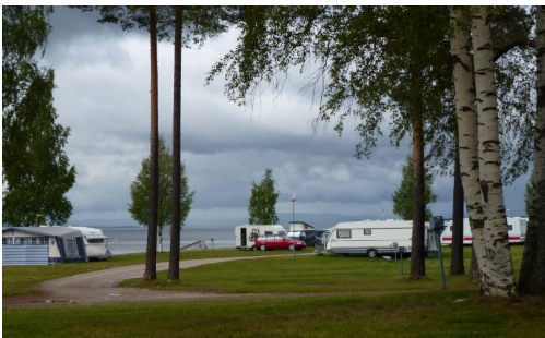
Camping aan het Siljanmeer