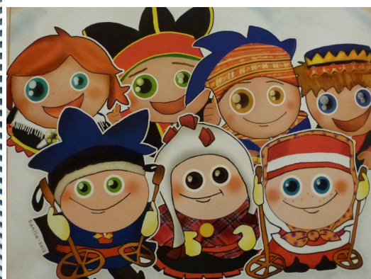
Vrolijke Samen samen met de TCC