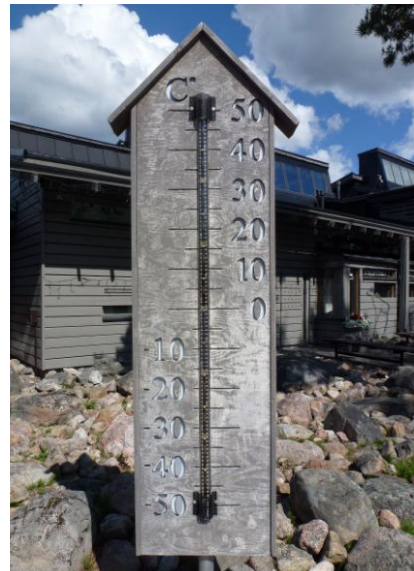
Het kan warm en koud zijn op de poolcirkel.

Woensdag 13 juni vertrekken wij samen met Rinus en Riet bij schitterend weer, mooie strakke blauwe lucht en een heerlijke temperatuur. Maar na ca 100 kilometer wordt het snel minder en begint het af en toe te regenen, we komen enkele rendieren tegen die op de weg blijven staan maar na getoeter beginnen te rennen en uiteindelijk de berm inschieten. Als we boven de 400 meter hoogte zitten komen we zelfs in mist terecht en zakt de temperatuur na 5 graden. Als we om 14.00 uur in regen aankomen op de camping komen de eersten al binnen terwijl wij nog bezig zijn met het inchecken.