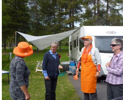
Oranje gekte slaat toe.