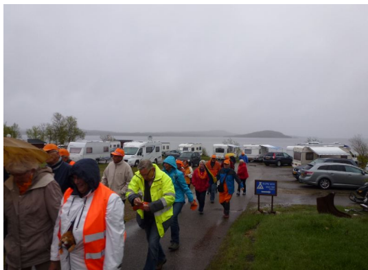
Camping in Inari.

Helaas wordt het een nederlaag en gaan we een beetje triest terug naar de camping waar het inmiddels niet meer regent. Donderdagmorgen staan we op en het is stralend mooi weer een strak blauw hemel begroet ons en we gaan na het ontbijt naar Inari. We bezoeken als eerste het Samen congressentrum waar toevallig een congres plaats heeft inzake de klederdracht, we zien veel mensen in klederdracht maar krijgen niet de kans om hen op de foto te krijgen. Gelukkig wordt er iemand geïnterviewd voor de TV en krijgen we nog de kans om een dame te fotograferen.