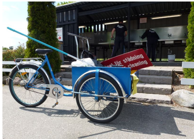
De schoonmaak dienst