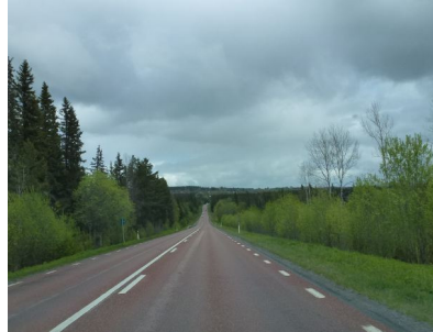
En eeuwig zingen de bossen