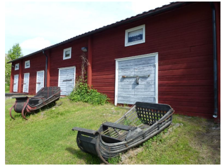
Slapen boven de stal.