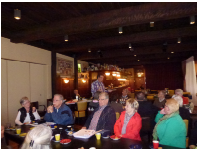
de reisleiding geeft uitleg