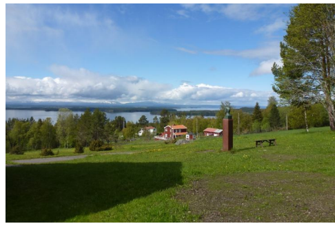
Buitenverblijf Wilhelm Peterson – Berger met uitzicht op de bergen.

Woensdag 6 juni staan we op met een zon aan de hemel, de gehele dag is het droog tot aan de aankomst op de mooie camping in Vojman. We staan aan een wild stromende rivier deze heeft een extreem hoge stand door de grote regenval en de dooi in de bergen. Het was ook een mooie rit we hebben een paar elanden gezien en de natuur is geweldig met al die meren en rivieren. Vandaag is het een nationale feestdag en dat is goed te merken op de weg die nu nog stiller en verlaten is dan op de werkdagen. Omdat Zweden feest viert gaan wij dat ook een beetje doen wij beiden allen een paar broodjes met braadworst aan waarbij ze dan hun eigen drankje meebrengen. Het wordt een heel gezellig uurtje maar jammer dat er even een kleine bui overtrok. Maar tegen 21.00 uur beginnen er veel nog aan een avondwandeling en genieten van de zon die achter de heuvels verdwijnt. We gaan weer op tijd slapen want morgenvroeg zullen we als eerste vertrekken voor de rit van 350 km naar Luleå aan de Botnische golf onze laatste camping in Zweden.