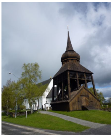
De prachtig gerestaureerde kerk van Frösön