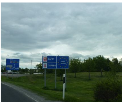
We bereiken Finland