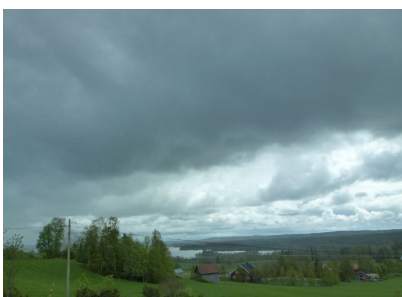
Dreigende wolken stille wegen