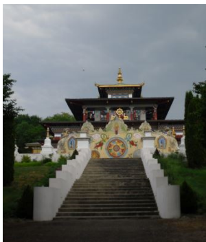
De tempel Monastere Tibetan Kagyu Ling