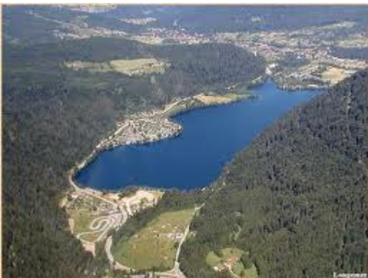
Het mooie meer in de Vogezen.

Camping Belle Rive 88400 / Xonrupt-Longemer N 48° -04' – 05" E 06° - 56' – 52"