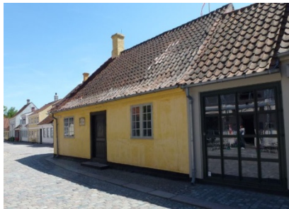
H.C. Andersen hus in Odense.