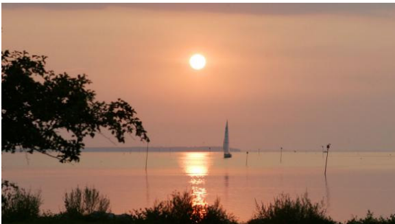
Zonsondergang in Ribe

Verblijf op deze gastvrije camping met geweldige fiets en wandelmogelijkheden het uitzicht naar de mooie brug over de grote Belt is uniek. Ook kunt u de geboorte stad van Hans Christiaan Andersen in Odense bezoeken. Fünen heeft ons veel te bieden. Maar ook een uitstapje naar Kopenhagen met eigen vervoer of per trein is mogelijk. We zullen ons verblijf afsluiten met een heerlijk Deens smørgasbrød.